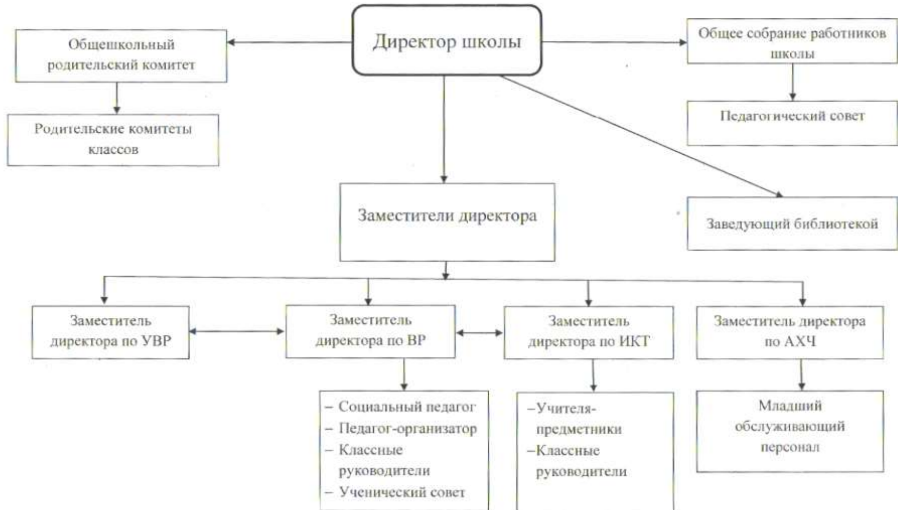
Схема управления образовательной организацией